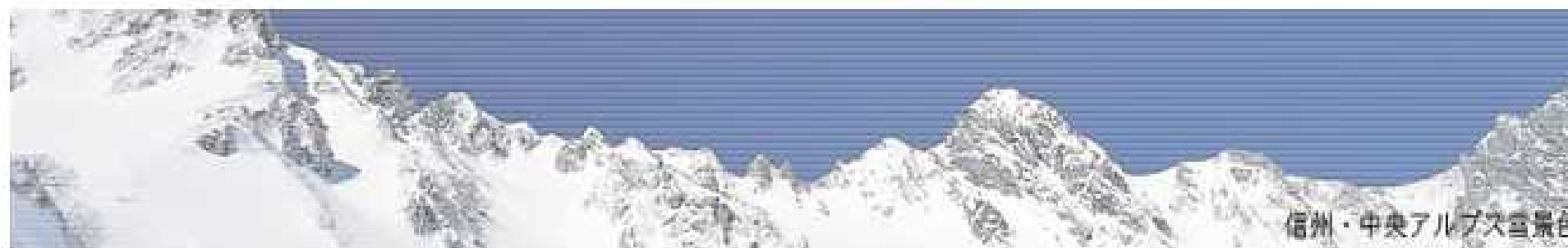
信州・中央アルプス雪景色