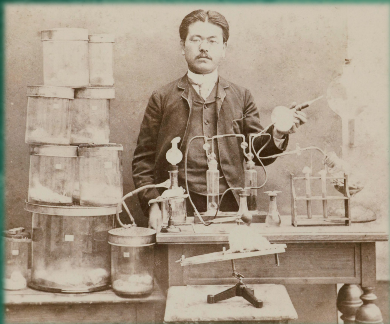
慶應医学部初代学部長 北里柴三郎 「破傷風の血清療法確立を記念して」1890年ドイツにて