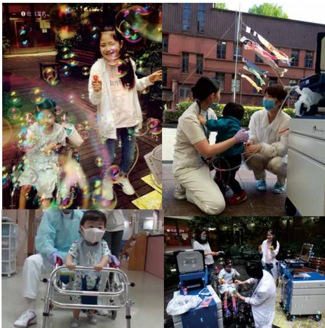
図1 リハビリテーションの風景